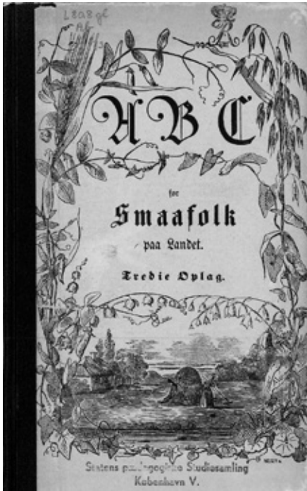
ABC for Smaafolk paa Landet (1871).

1800-tallet var en sand storhedstid for ABC-genren: Titlerne var rige i antal, og mange af dem udkom i adskillige oplag. Opmærksomhed omkring bogstavernes navne, forskellige lyde og form indgik i varierende grad i alle ABC'er, men metoderne skiftede, således at en stavelsesbaseret didaktik i løbet af 1800-tallets anden halvdel blev overhalet af lydprincippet. Omtrunt på samme tidspunkt vægtede en del forfattere i øvrigt, at barnet i bogstavindlæringen burde kombinere læsning og skrivning. 20 I den angiveligt første danske videnskabelige artikel om ABC-genren, som blev udgivet i tidsskriftet Bogven-